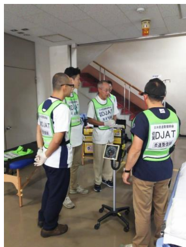
柔道整復師による受け入れ準備