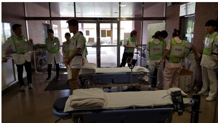
緑工リアの受け入れ準備(事務・医師・看護師)