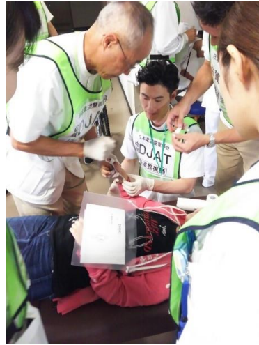
医師の指示により柔道整復師が脱臼を処置