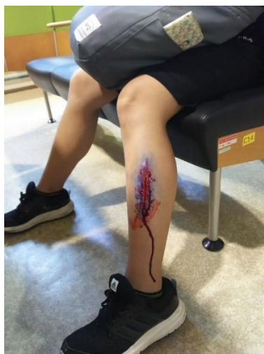
創傷もメイクでリアルに再現